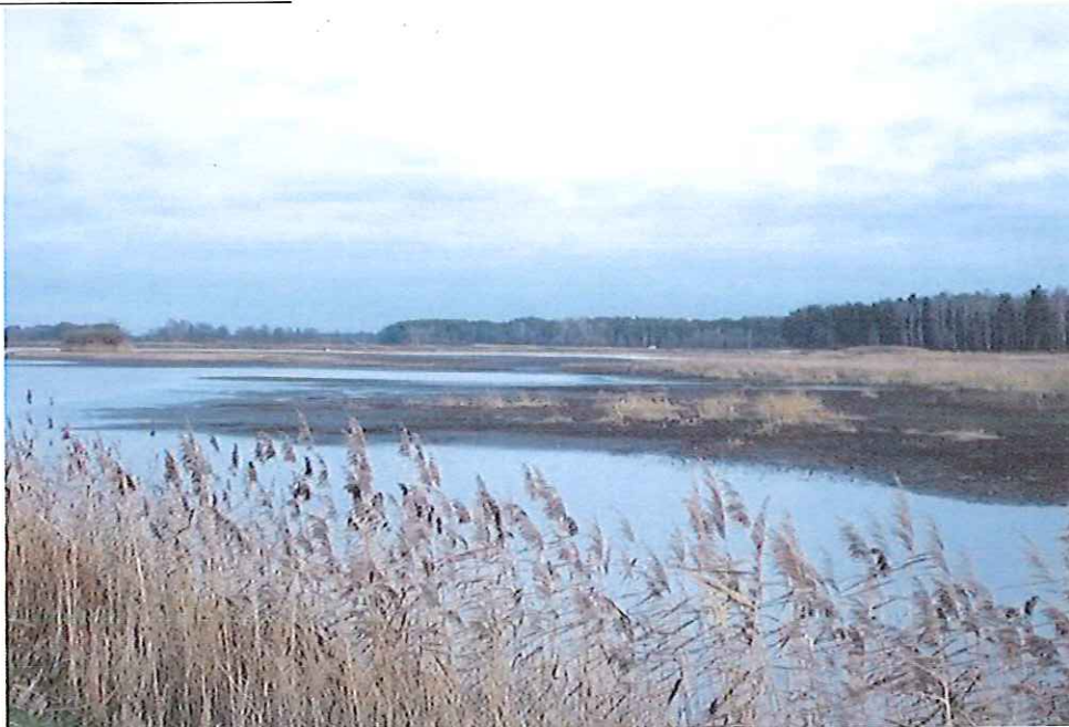
Stawy rybne na wschód od Przytyka

Stawy rybne zakładane także w miejscach oddalonych od dolin rzecznych, np. we Wrzeszczowie w 1784 r. istniały aż trzy sadzawki służące hodowli ryb 58 .