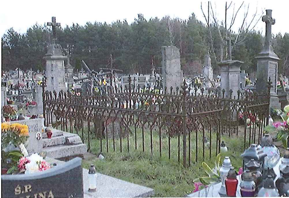
Widok cmentarza parafialnego we Wrzose