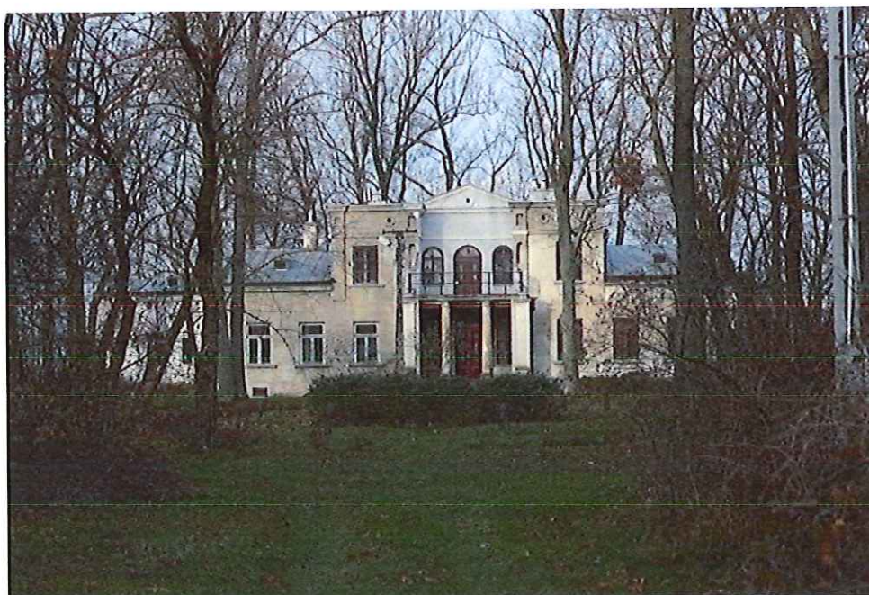
Dwór i fragment parku we Wrzeszczowie

Obecnie zabytkowy dwór znajduje się w rękach prywatnych – poddawany jest sukcesywnym pracom konserwatorskim.