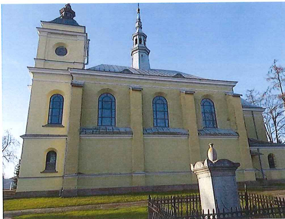
Kościół p.w. Podwyższenia Krzyża Świętego w Przytyku

Kościół p.w. Podwyższenia Krzyża Świętego, został wzniesiony w latach 1932–1936 według projektu arch. Stefana Szyllera, w miejscu starszego, drewnianego kościoła zbudowanego w 1779 r, a znajdującego się już – pomimo remontów przeprowadzanych w XIX w. Kościół jest murowaną budowlą neobarokową, trójnawową i halową. Sklepienia są kolebkowe na gurtach z lunetami w nawach, w prezbiterium krzyżowe. Fasada dwuwieżowa, część środkowa zwieńczona szczytem flankowanym ślimacznicami. Detal architektoniczny eklektyczny, neobarokowy w postaci portali i gzymsów.