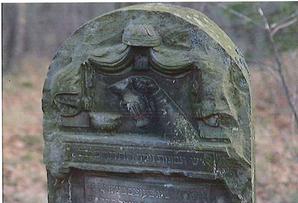
Macewa na cmentarzu żydowskim w Przytyku