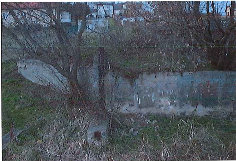
Pozostałości jazu przy młynie w Przytyku

Bardzo istotną kwestią kształtowania krajobrazu kulturowego jest estetyka przestrzeni publicznej. W trakcie prac rewaloryzacyjnych przestrzeni Rynku wprowadzono zarówno elementy posadzki rynku, jak i małej architektury – latarnie, ławki, kosze itp., zdecydowanie poprawiające jakość przestrzeni. Poważnym problemem wymagającym uregulowań obejmujących swoją skalą obszar całej gminy jest kwestia reklam, tablic reklamowych i