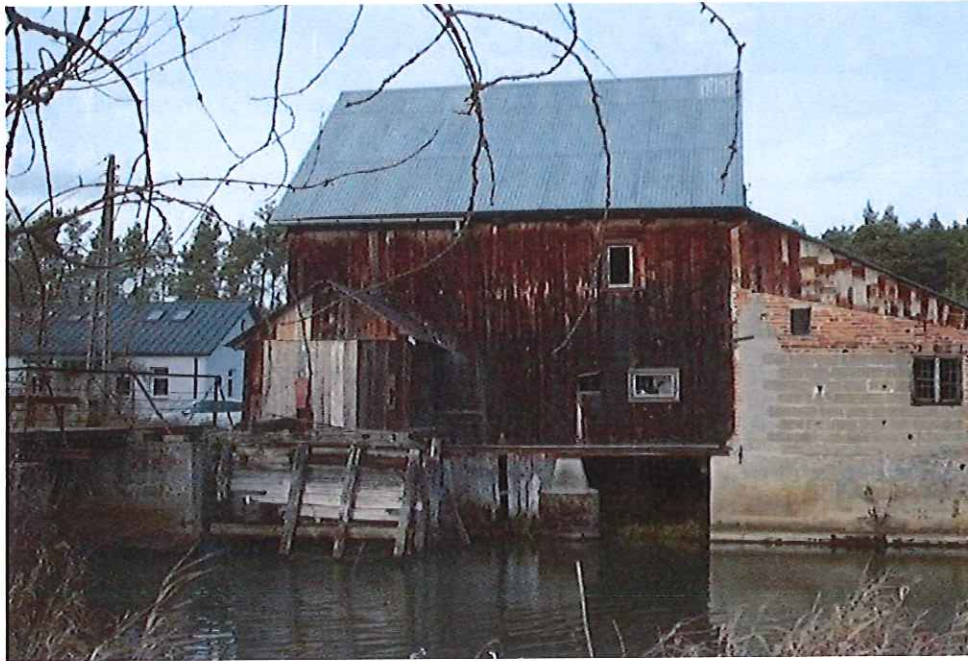
Młyn wodno-elektryczny we Wrzosie (fot. J. Dąbrowski, 2019)