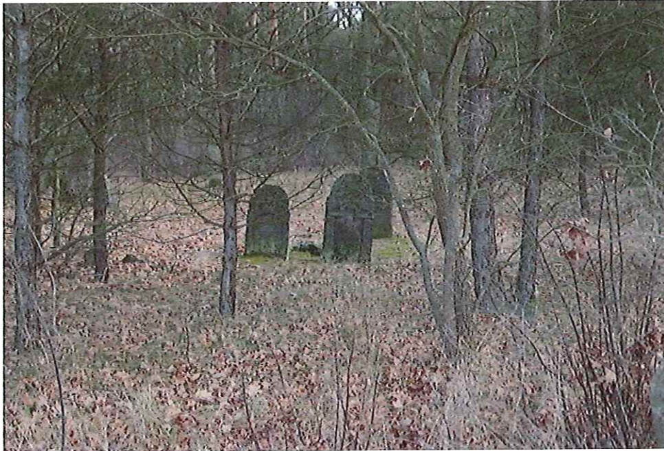
Widok fragmentu cmentarza żydowskiego w Przytyku