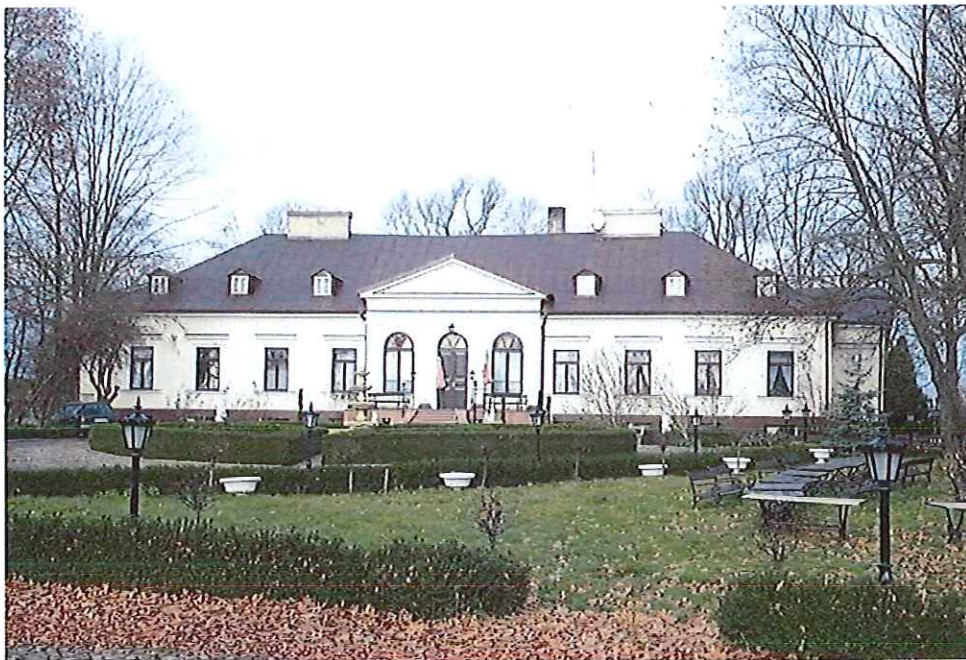
Dwór w Zameczku

Klasycyzujący budynek dworu został wzniesiony ok. poł. XIX wieku wg projektu Franciszka Marii Lanciego – znanego architekta, twórcy m.in. skrzydła pałacu w Wilanowie. Budynek jest murowany, parterowy. W elewacji północnej usytuowany jest portyk czterokolumnowy, zwieńczony tympanonem, w elewacji południowej ryzalit ozdobiony czterema pilastrami jońskimi również zwieńczony trójkątnym szczytem. W elewacjach bocznych ganki zakończone szczykami trójkątnymi. Dwór charakteryzuje bogaty detal architektoniczny w postaci gzymsów nadokiennych, opasek okiennych i drzwiowych, profilowanego gzymsu wieńczącego, boniowania narożnego, fryzów arkadkowych. Wnętrze budynku dostosowane zostało do nowych funkcji (restauracja).