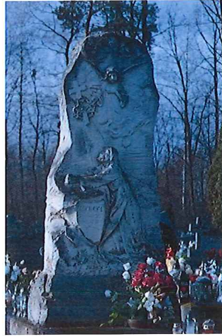
Pomniki nagrobne na cmentarzu parafialnym w Przytyku