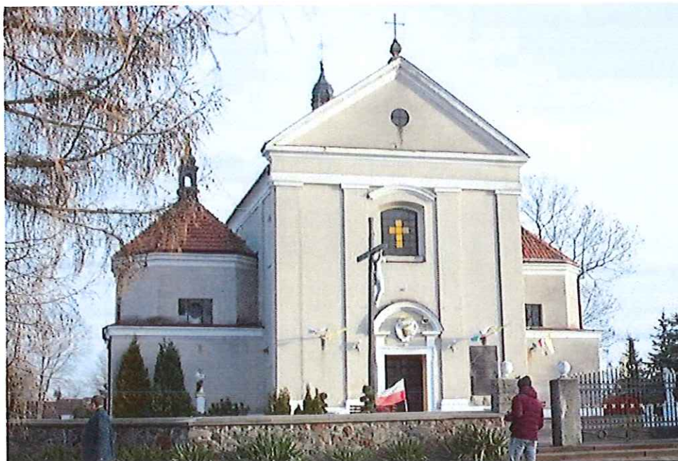
Kościół p.w. św. Marii Magdaleny w Wrzeszczowie

Wejście do kaplic arkadowe, ujęte w pilastry, w ścianach skrajnych nawy, arkadowe wnęki. W świątyni narożnikach kaplic niskie pilastry dźwigające gzyms. Fasada zachodnia trójdzielna, pilastrowana, z trójkątnym szczytem; na osi portal barokowy, z kartuszem w półkolistym przyczółku oraz okno zamknięte odcinkowo.