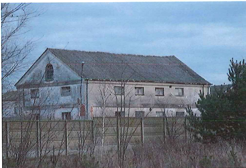
Dawny spichlerz w folwarku w Oblasie

Budynek zbudowany w 1 poł. XIX w., jako obiekt murowany, otynkowany, na rzucie prostokąta, o zwartej bryle, dwukondygnacyjnej z poddaszem. Nakryty dachem dwuspadowym (pokrycie dachowe z eternitu). Naroża budynku boniowane, gzyms wieńczący wydatny, gzyms kordonowy prosty. Otwory okienne prostokątne w układzie poziomym. W szczycie okno zakończone łukiem. Stolarka okienna drewniana, ramowa. W latach 30-tych XX w. obiekt wyremontowano. W 1985 roku wymieniono pokrycie dachowe.